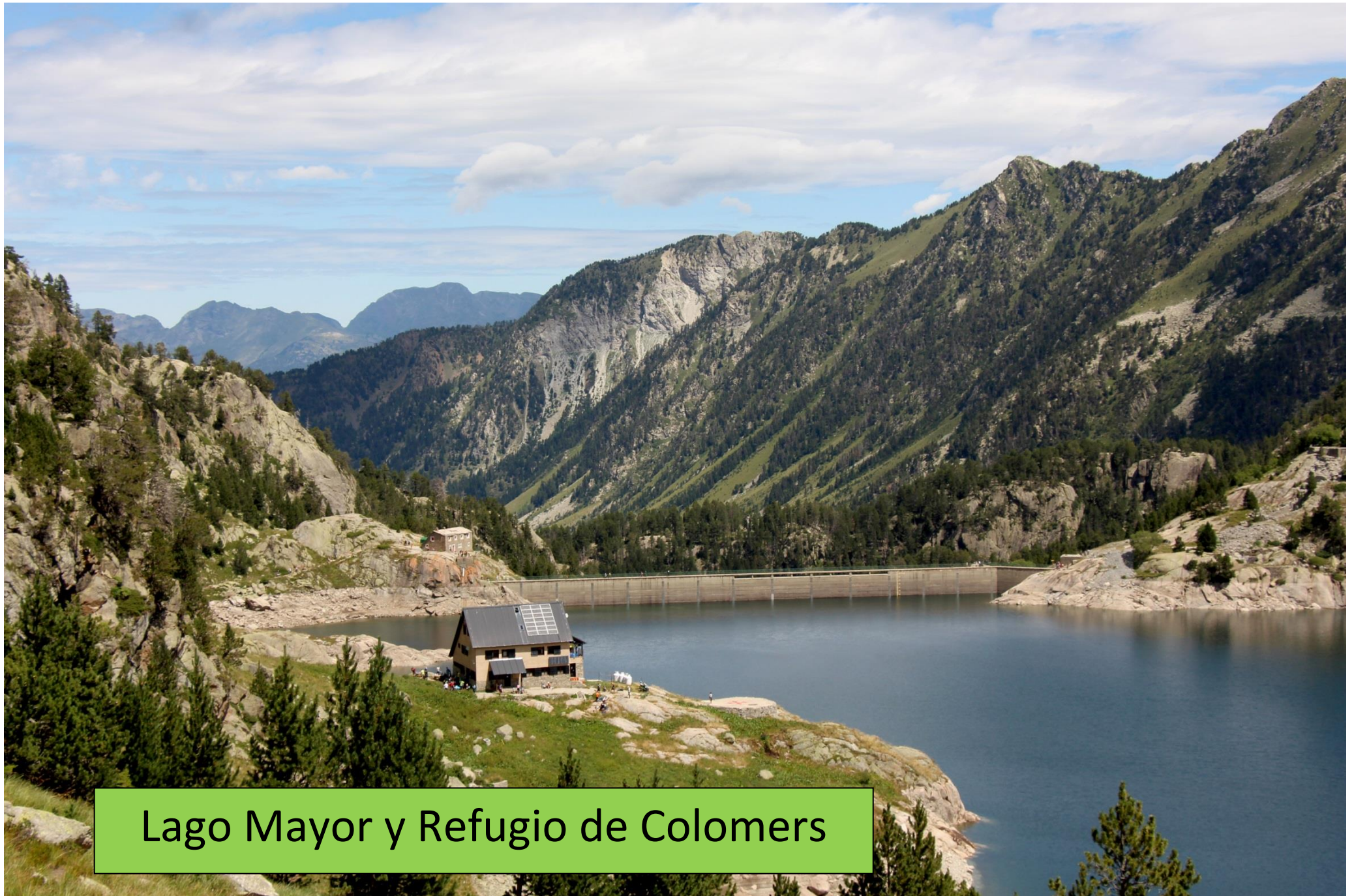
Lago Mayor y Refugio de Colomers